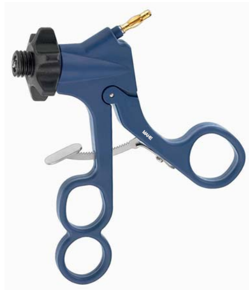
Carbon Griff, Raste, HF-Anschluss Carbon handle, ratchet, HF-connector 19.260