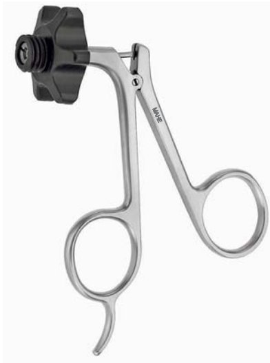
Metallgriff Metal handle 19.20