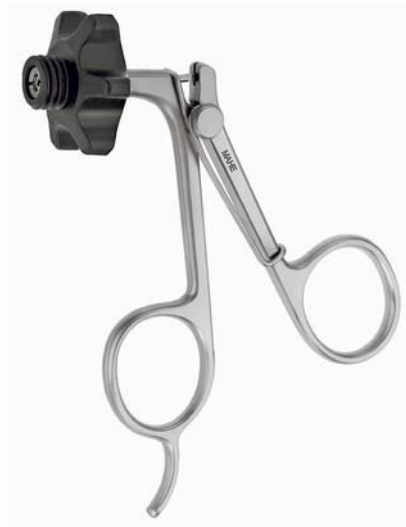
Metallgriff mit Feder Metal handle with spring 19.21