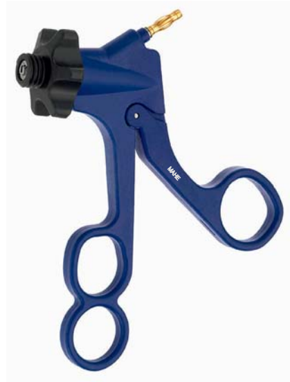
Carbon Griff, Feder, HF-Anschluss Carbon handle, spring, HF-connector 19.250