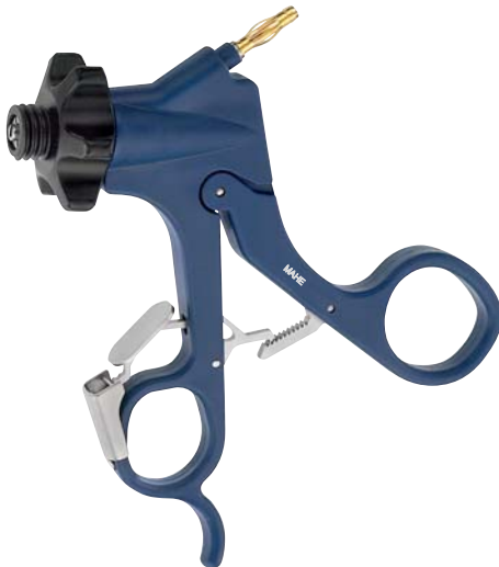
Carbon Griff, aktivierbare/deaktivierbare Raste, HF-Anschluss (Fingerauflage) Carbon handle, activating/deactivating ratchet, HF-connector (finger rest)