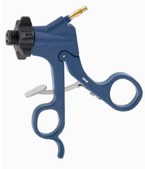
Carbon Griff, Raste, HF-Anschluss (Fingerauflage) Carbon handle, ratchet, HF-connector (finger rest)