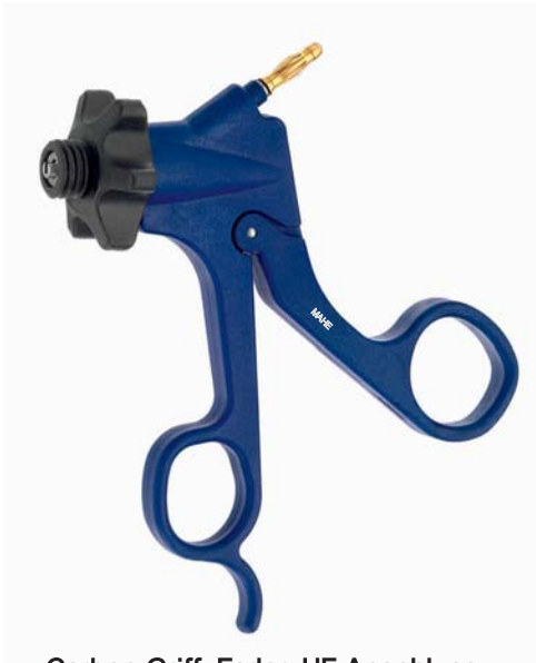
Carbon Griff, Feder, HF-Anschluss (Fingerauflage) Carbon handle, spring, HF-connector (finger rest) 19.251