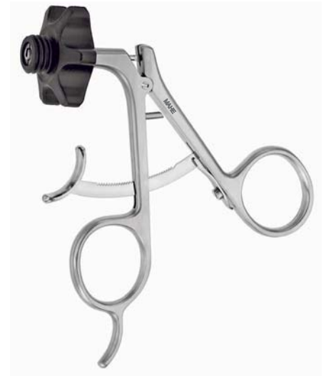
Metallgriff, Raste Metal handle, ratchet 19.22