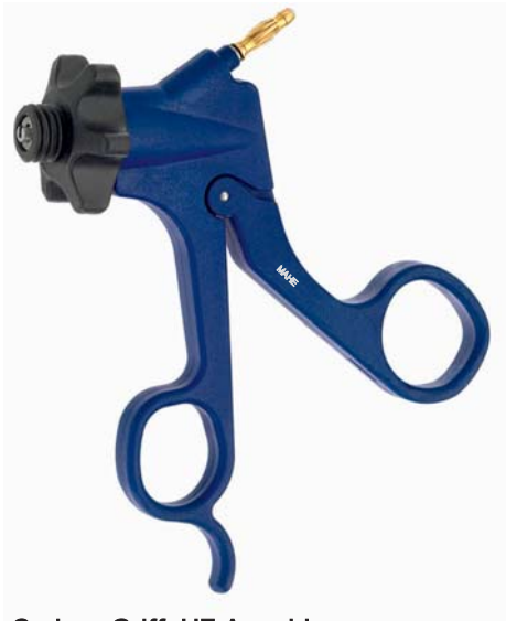
Carbon Griff, HF-Anschluss (Fingerauflage) Carbon handle, HF-connector (finger rest) 19.241