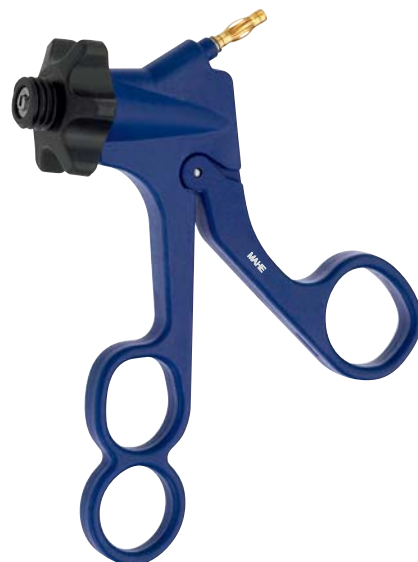
Carbon Griff, HF-Anschluss Carbon handle, HF-connector 19.240