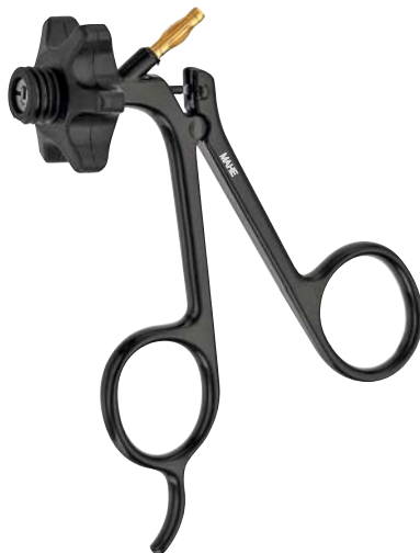
Isolierter Metallgriff, HF-Anschluss Insulated metal handle, HF-connector 19.26