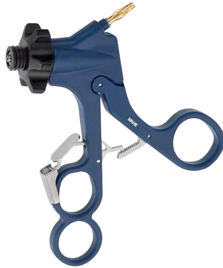
Carbon Griff, aktivierbare/deaktivierbare Raste, HF-Anschluss Carbon handle, activating/deactivating ratchet, HF-connector