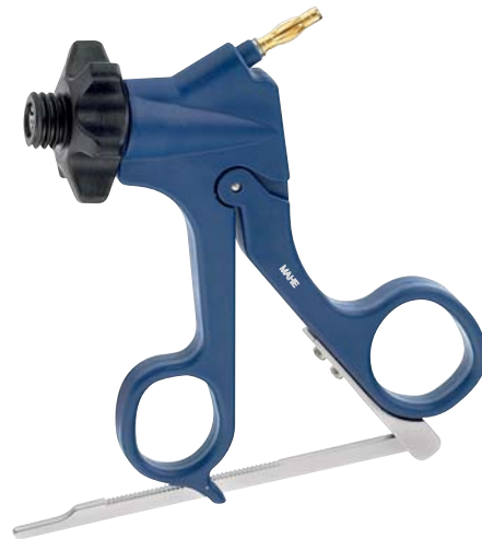
Carbon Griff, Klappraste, HF-Anschluss Carbon handle, 'swingaway', HF-connector